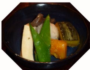
煮物盛り合わせ 5.50 (日によって異なります)

昔ながらのお惣菜 PR コーナー Today's Special をご覧ください(日により 品物が異なります)