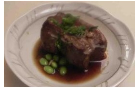
Japanese Style Stewed Pork 7.95 ぶた角煮