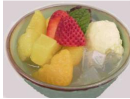
Cream Anmitsu $5.50 (cocktail of agar jelly and fresh fruits, topped with sweet red bean and vanilla ice cream) クリーム あんみつ