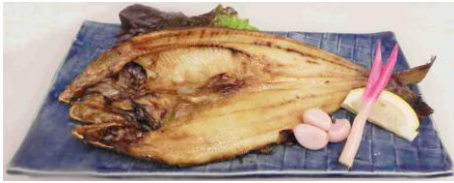
Grilled Atka Mackerel ホッケの開き / あじの開き