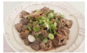
Slow Cooked Beef Gristle 5.25 牛すじ煮込み