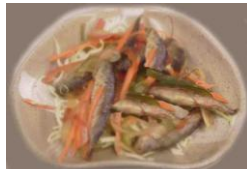
Marinated Deep Fried Small Jack Mackerel 4.95 豆あじの南蛮漬け