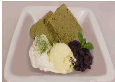
Green Tea Chiffon Cake $5.50 (sweet Red Beans & Whipped Cream) (抹茶シフォンケーキ)