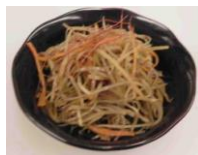
Spicy Burdock 4.00 キンピラごぼう