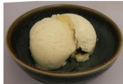
Vanilla Ice Cream or Green Tea Ice Cream $3.00 (Made with Cage Free Eggs //additional Sweet Red Bean + 50 ¢) (バニラ, 抹茶アイスクリーム + あずき 50 ¢)