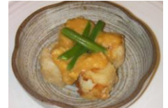
Taro w/ Chicken Meat Sauce 5.50 小芋そぼろ

煮物 炊き合わせ 小芋の煮ころがし かぼちゃの煮物 高野豆腐 こんにやく 筑前煮 野菜豆 ナスの煮浸し 蓮根のピリ辛炒め ピリ辛胡瓜炒め 豚汁 他