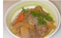
Beef, Potato and Vegetable 5.95 肉じゃが