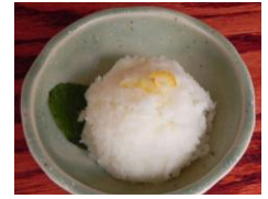
Yuzu Sorbet $ 3.00 (柚子ソルベ)