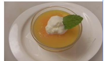
Fruit Jerry $4.50 (フルーツゼリー)