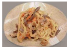
Slow Cooked Dried Radish 4.00 切干大根