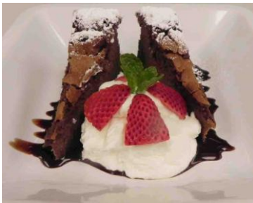
Chocolate Cake Gateau au Chocolate $5.50 (ガトーショコラ)