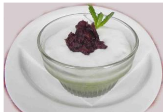
Green Tea Bavarian $4.50 (抹茶のババロア)